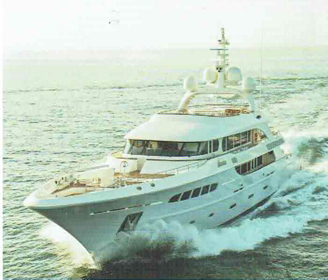
"Mooie lijnen zonder poespas", zegt Van Meer over zijn Nassima ontwerp, een in 2012 door Acico Yachts in Enkhuizen gebouwd 49 meter jacht.