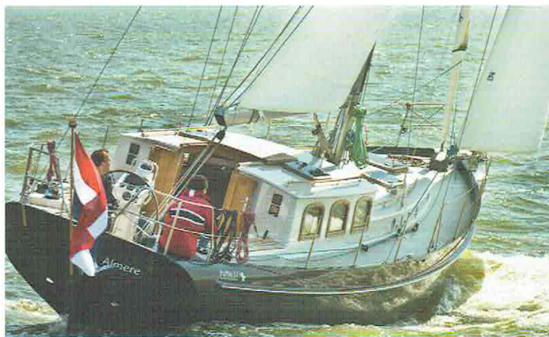
De door VMG gebouwde Puffin 37 is geheel gemoderniseerd.