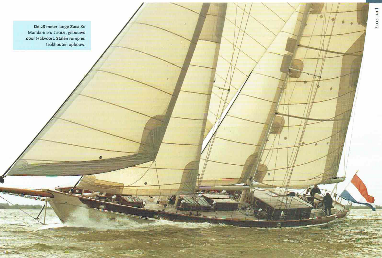
De 28 meter lange Zaca 80 Mandarine uit 2001, gebouwd door Hakvoort. Stalen romp en teakhouten opbouw.