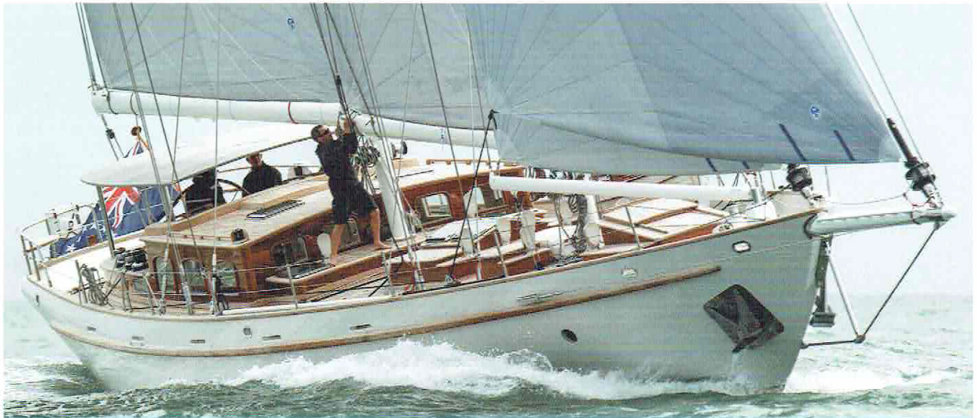
De Wolfhound, een 19,55 meter lange klassiek gelijkende schoener van composiet, in Engeland gebouwd, is dit jaar in de prijzen gevallen.

gewaardeerd óf verguisd. Ik was er te vroeg mee; pas jaren later werd deze vormgeving mainstream. Van een ander ontwerp met een vergelijkbare stijl, de Goeree, zijn er veel gebouwd."